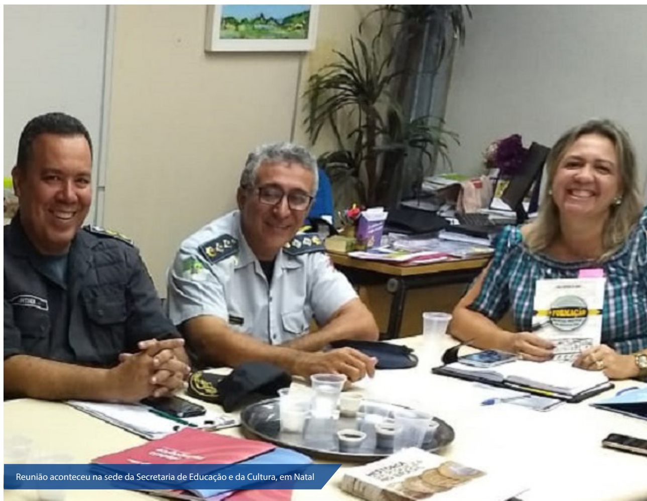
Reunião aconteceu na sede da Secretaria de Educação e da Cultura, em Natal

Projeto é estudado pela Comissão Conjunta de Planejamento do Colégio Militar, junto à Coordenadoria de Desenvolvimento Escolar e Sub coordenadoria de Inspeção Escolar do RN