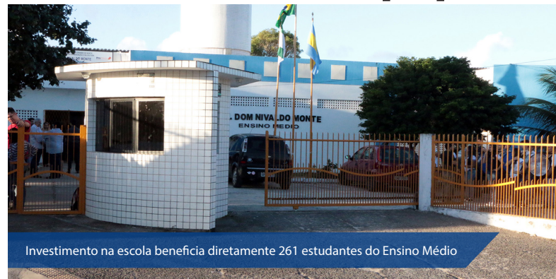
Investimento na escola beneficia diretamente 261 estudantes do Ensino Médio

Todas as mudanças têm como meta atender melhor os estudantes. "Esta entrega faz parte do trabalho do nosso governo de preparar e qualificar todas as escolas estaduais, e em especial as de ensino em tempo integral. Não tínhamos nenhuma escola deste tipo em nosso estado e hoje já temos 49 funcionando. A Dom Nivaldo Monte é uma delas", destacou o governador Robinson Faria.