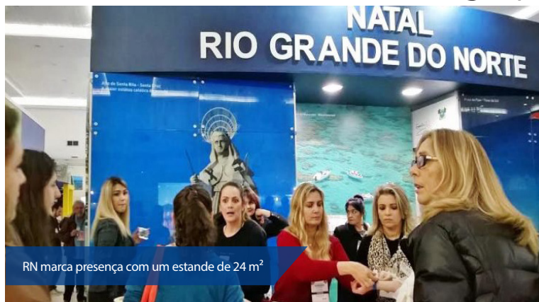
RN marca presença com um estande de 24 m²

“Esperamos receber em nosso estande, agentes, jornalistas especializados e ope-